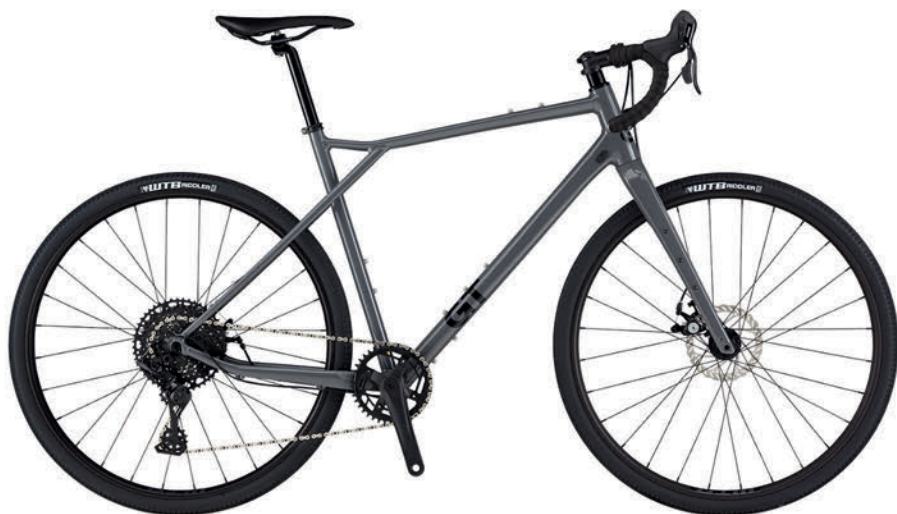
ウェットセメントグレー