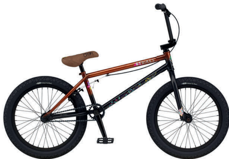
ピーチブラックフェード