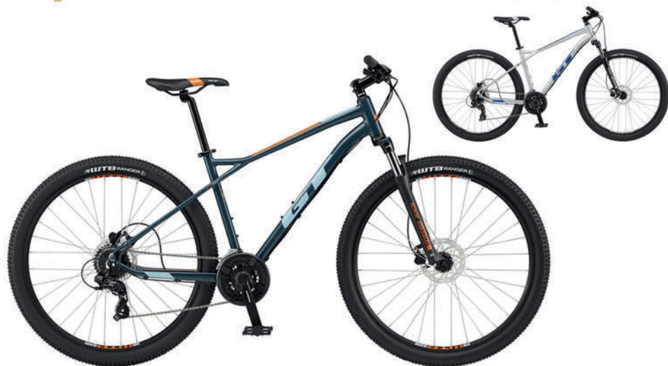
スレートブルー シルバー