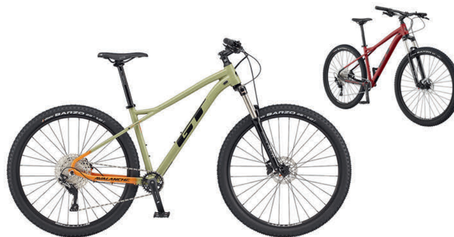
モスグリーン レッド