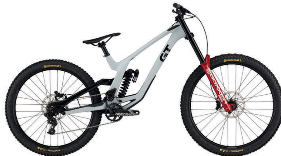
バトルシップグレー