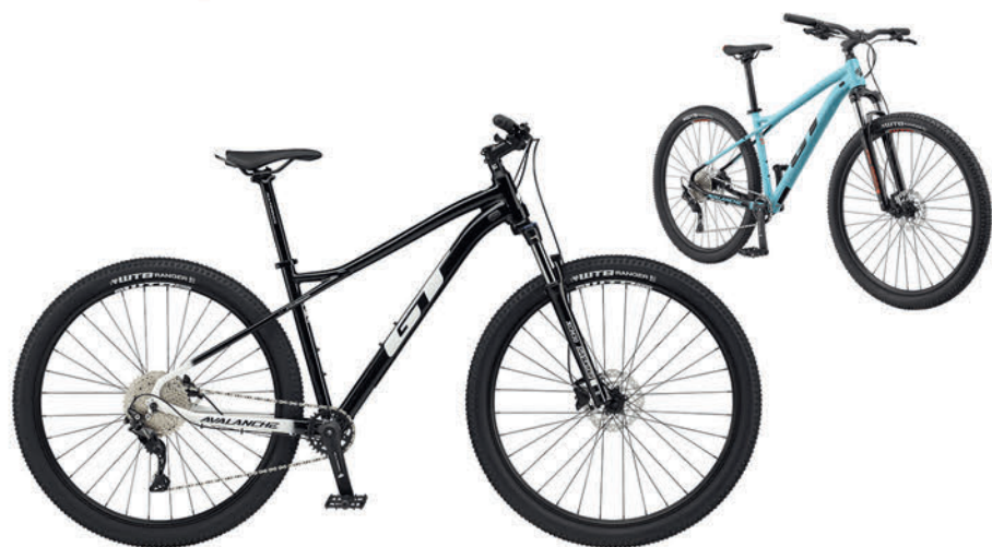
ブラック アクアブルー