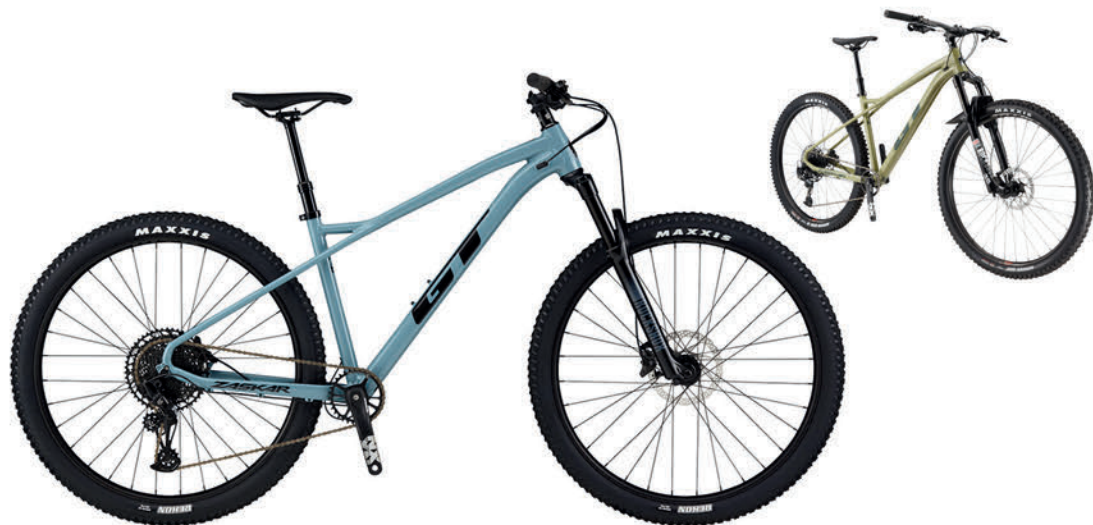
ジュングローム モスグリーン