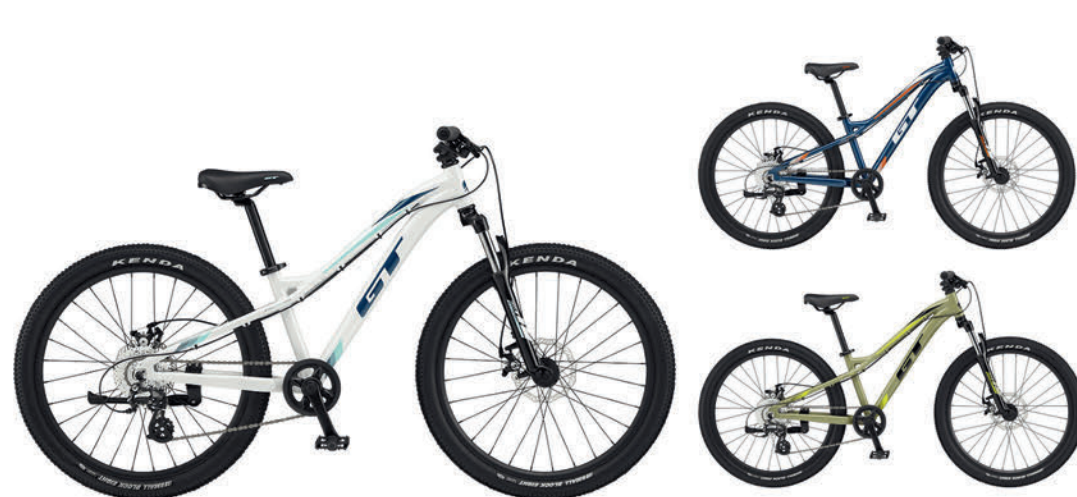
ホワイト ディープティール モスグリーン