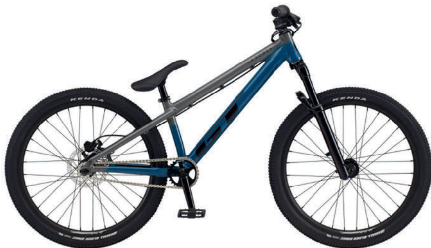
ダスティブルーフェード