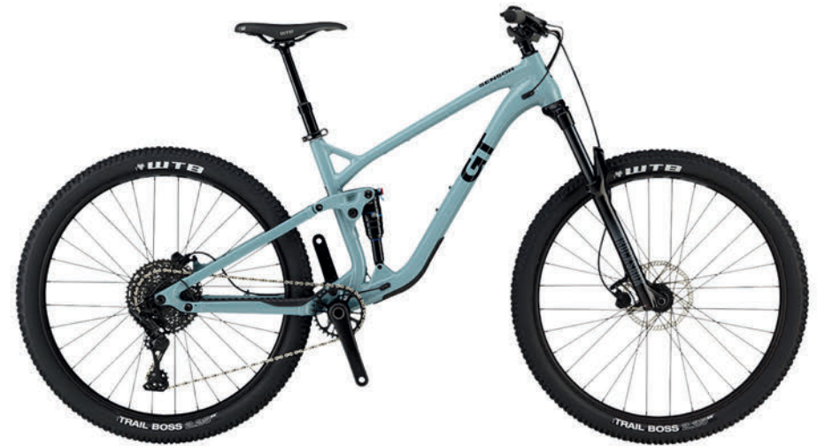
ジューングローム