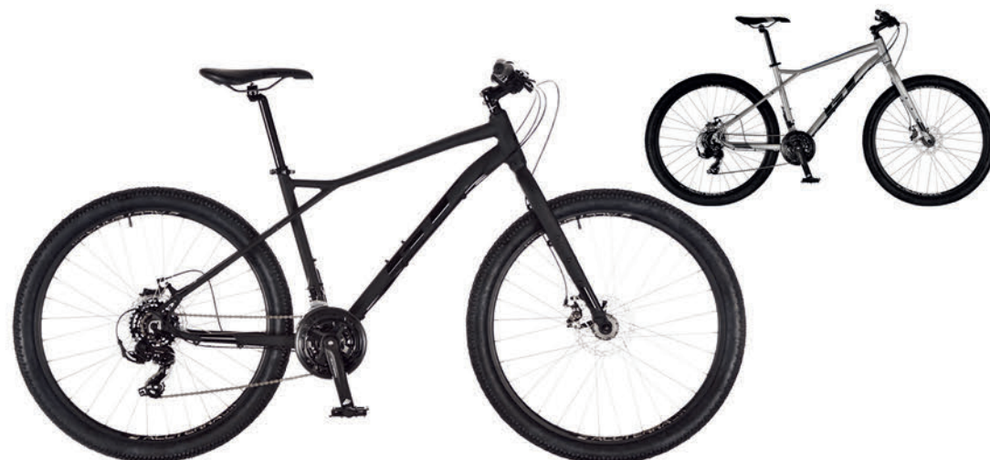
ブラック シルバー