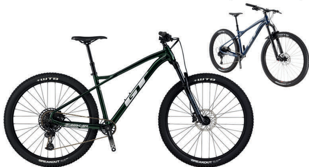
グリーン ダークブルー