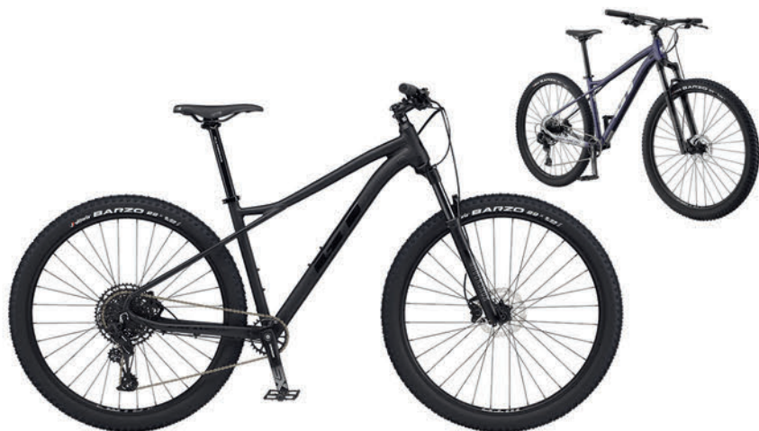
ブラック パープル