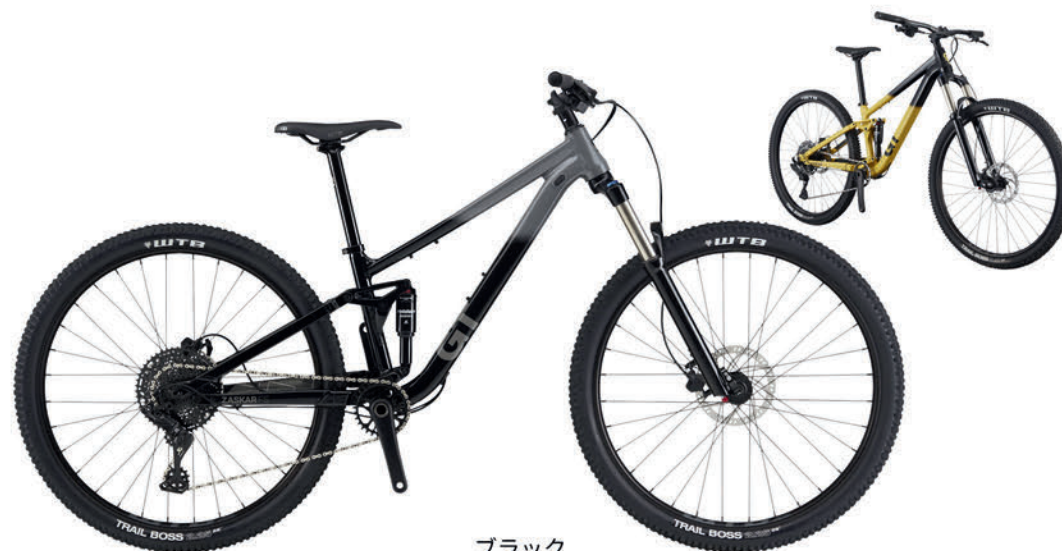
ブラック イエロー