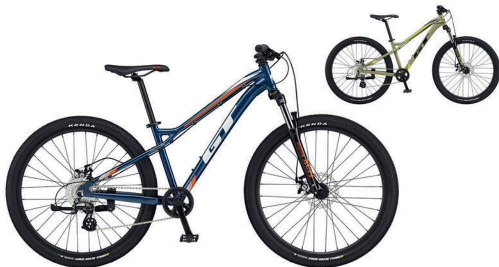
ディープティール モスグリーン