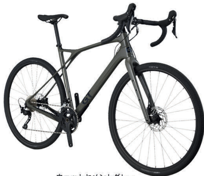
ウェットセメントグレー