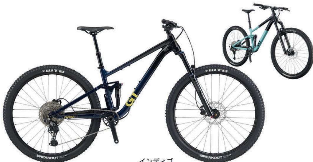
インディゴ シーグリーン