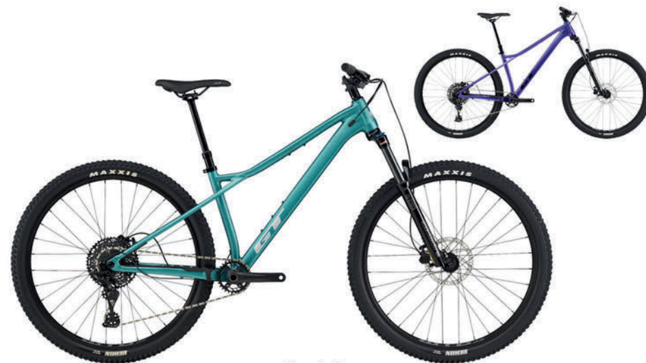
ジェイド パープル