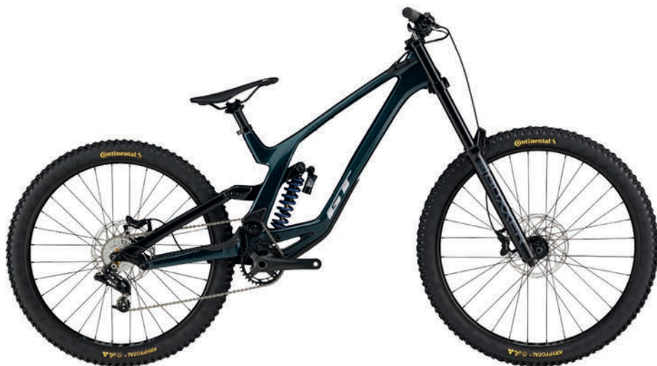
トロピックグリーン