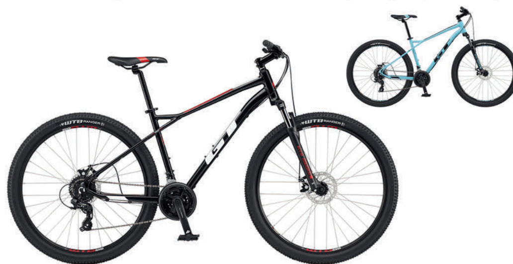
ブラック アクアブルー