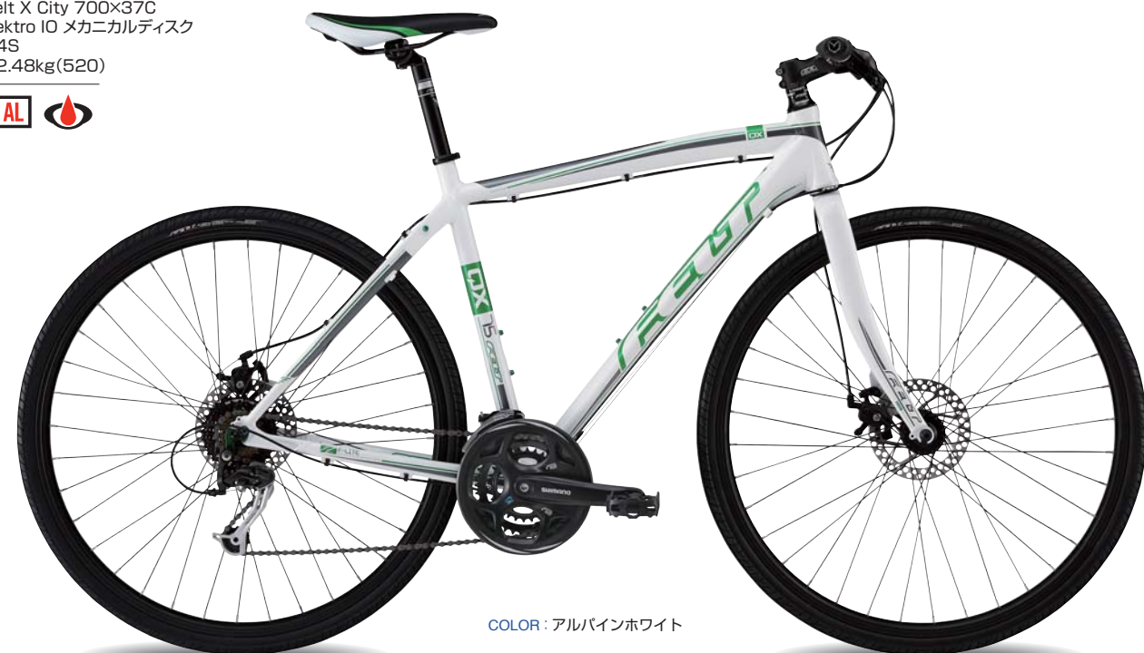
COLOR: アルバインホワイト