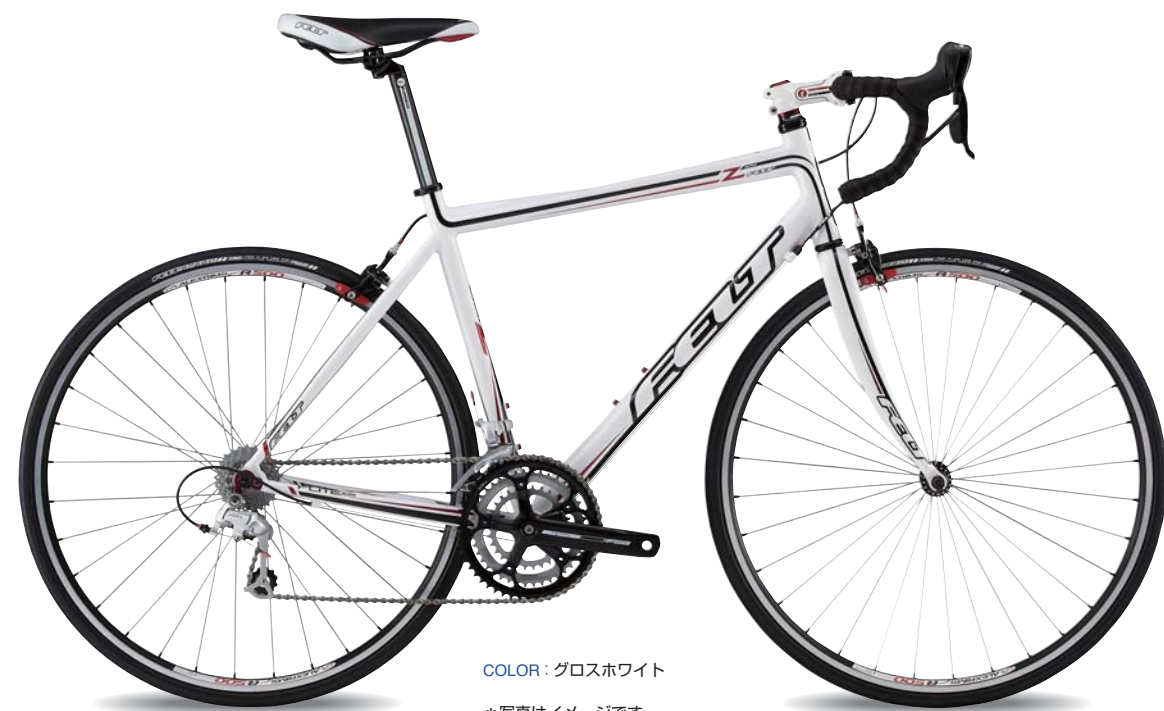
COLOR : グロスホワイト

*写真はイメージです。 クランクは変更になります。 ペダル、補助ブレーキが付属します