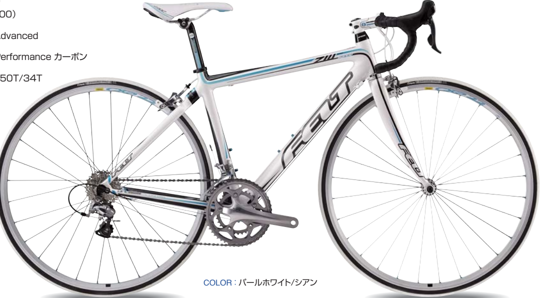
COLOR : パールホワイト/シアン