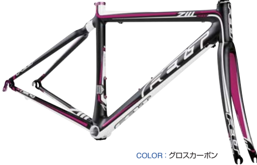
COLOR : グロスカーボン