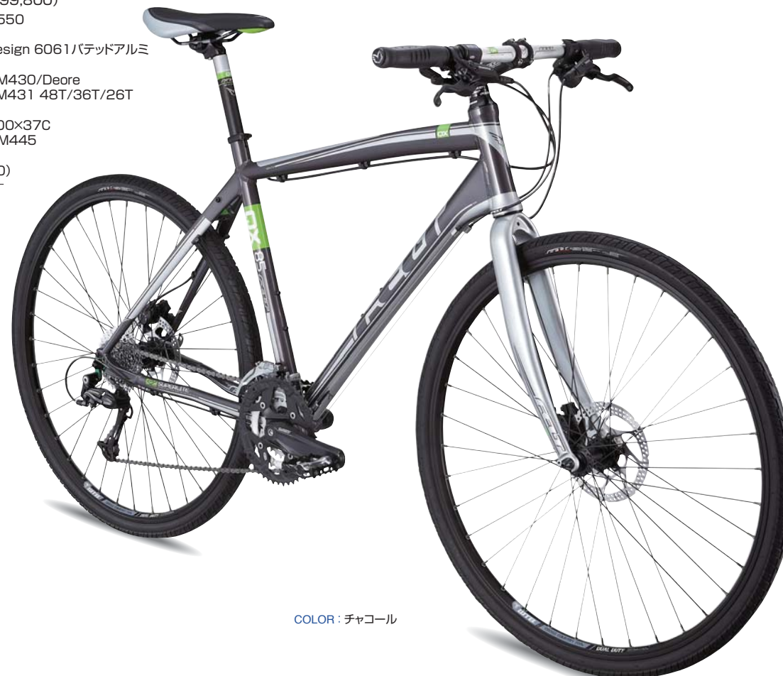
COLOR : チャコール

アルミ製リジッドフォーク、27段変速、 軽量なアルミ製バテッドチューブフレームなどを採用。 QXシリーズの中でも高い走行性能を備えたモデル。