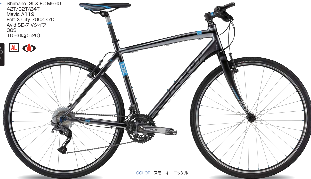
COLOR : スモーキーニッケル