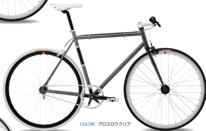
COLOR: グロスロウクリア