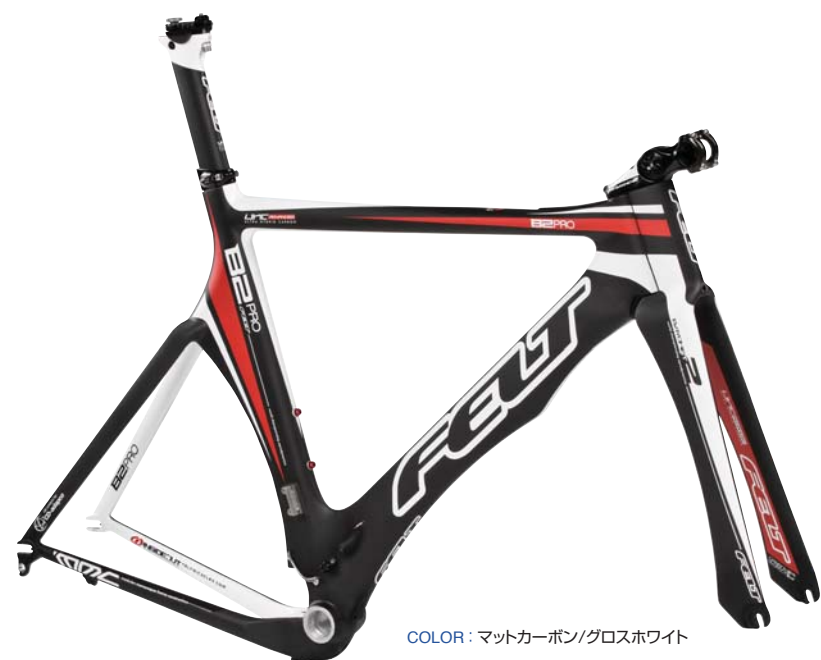
COLOR : マットカーボン/グロスホワイト