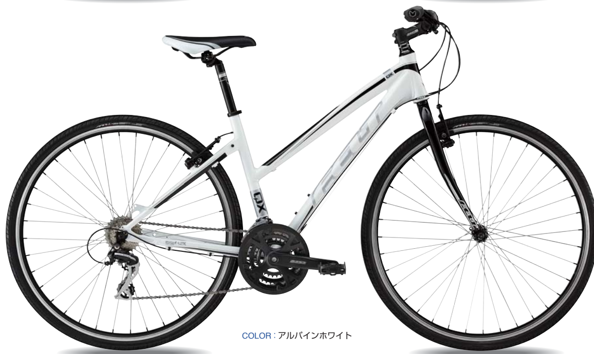
COLOR : アルパインホワイト

QX65と同じ装備で女性のためにカスタマイズしたモデル。 またぎやすいフレーム設計と女性の体に合わせたサドル形状が特徴。