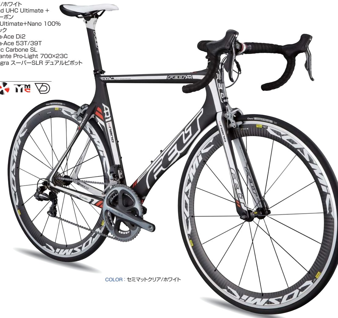
COLOR : セミマットクリア/ホワイト