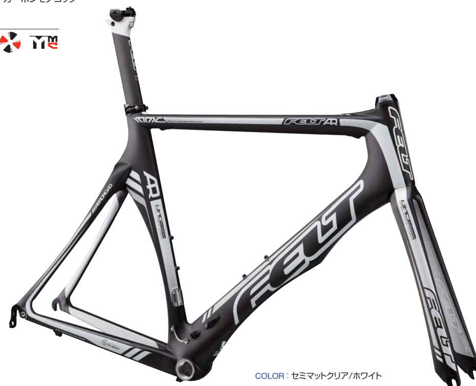
COLOR : セミマットクリア/ホワイト