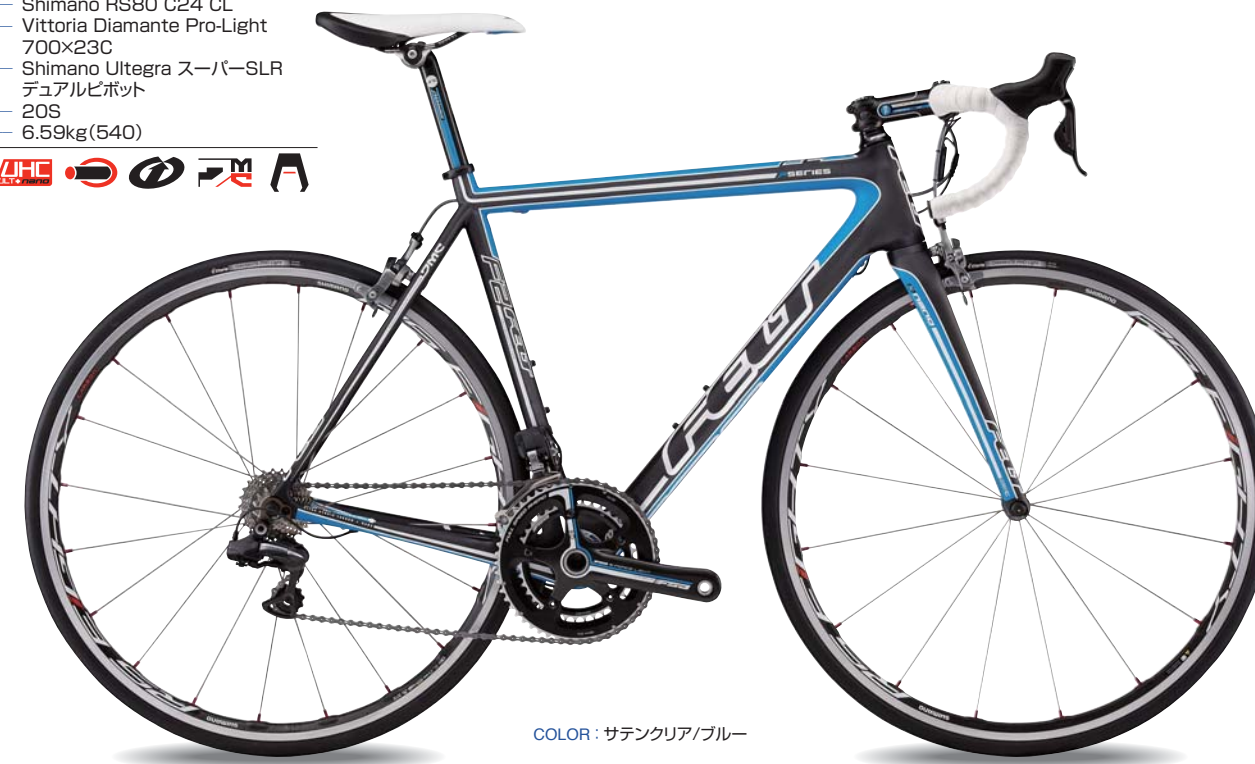
COLOR : サテンクリア/ブルー