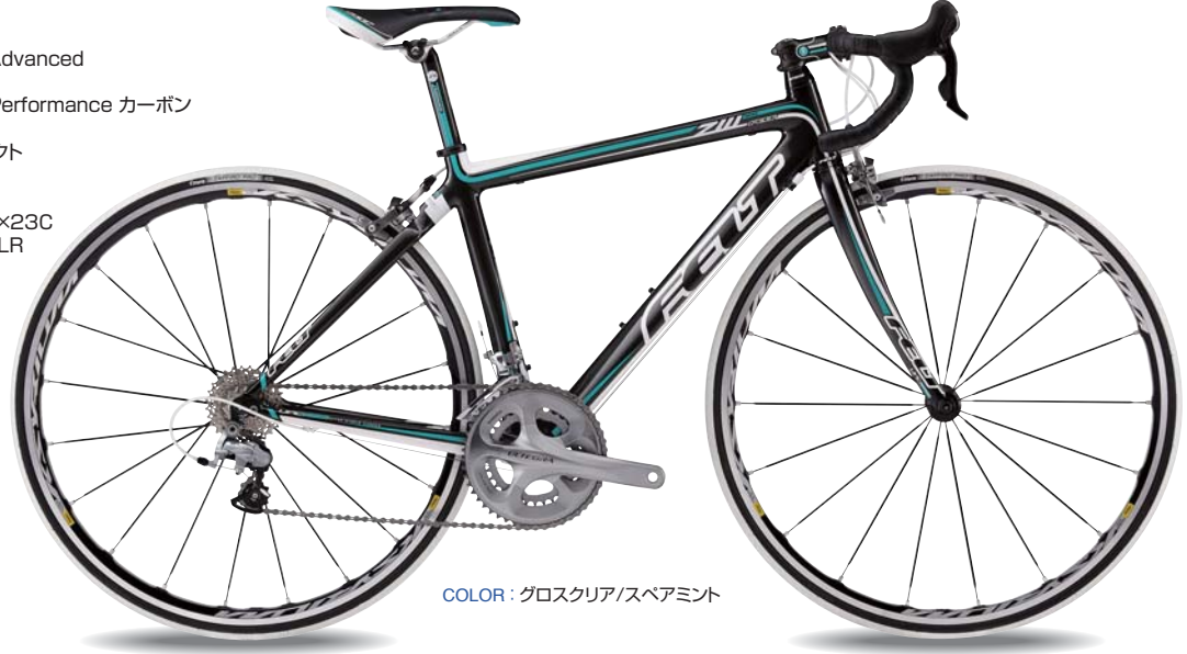
COLOR : グロスクリア/スベアミント