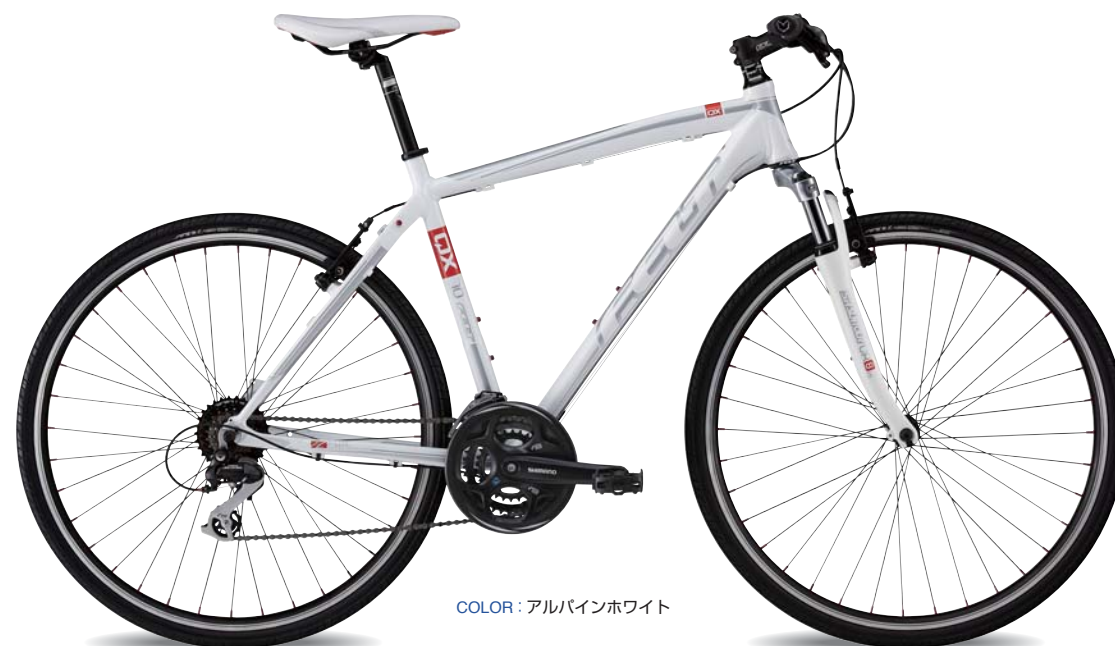
COLOR: アルバインホワイト

QX65にフロントサスペンションを装備する事で、快適性が大きく向上。 変速ギヤのグレードを上げることで、正確な変速操作を可能にしました。