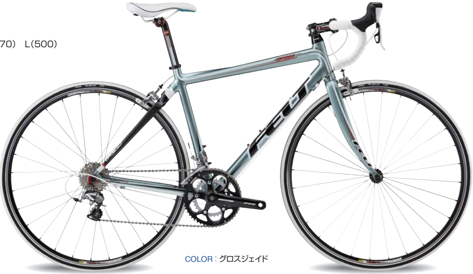
COLOR : グロスジェイド