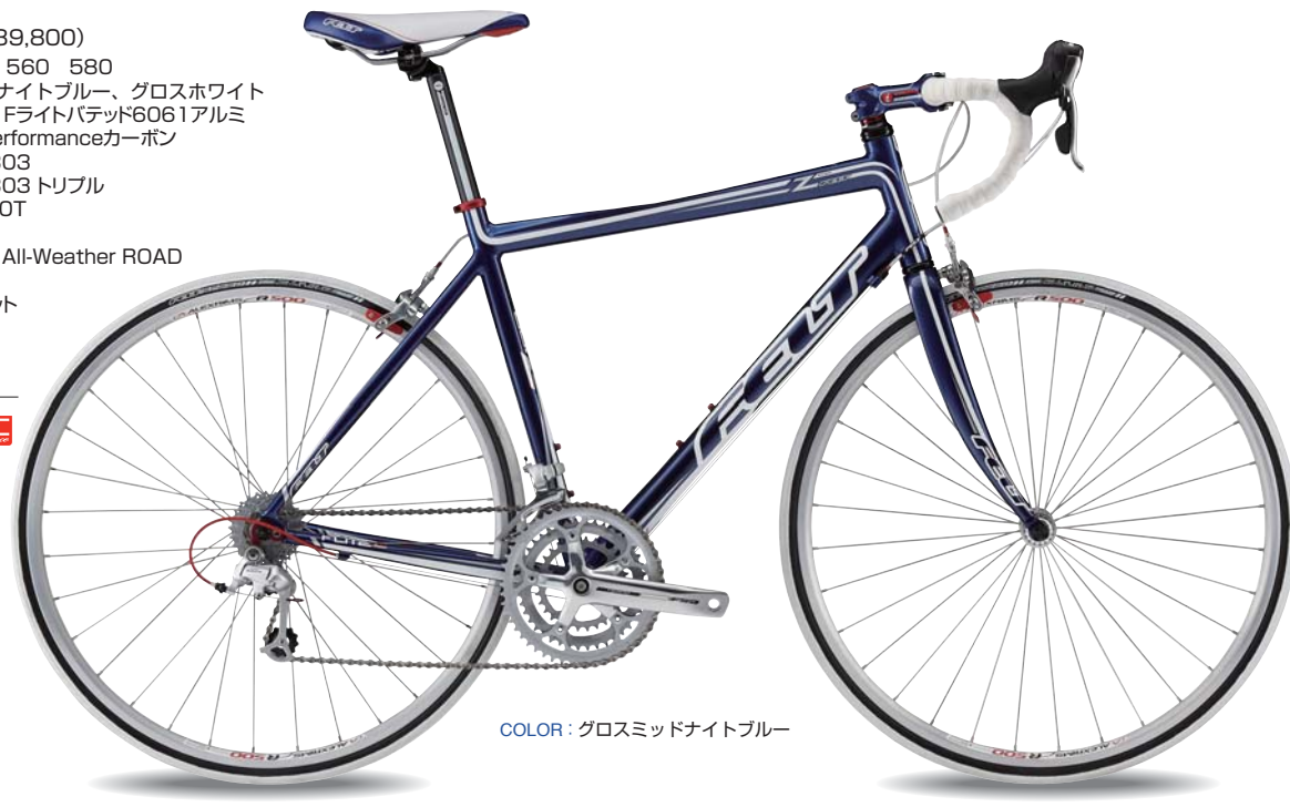
COLOR : グロスミッドナイトブルー