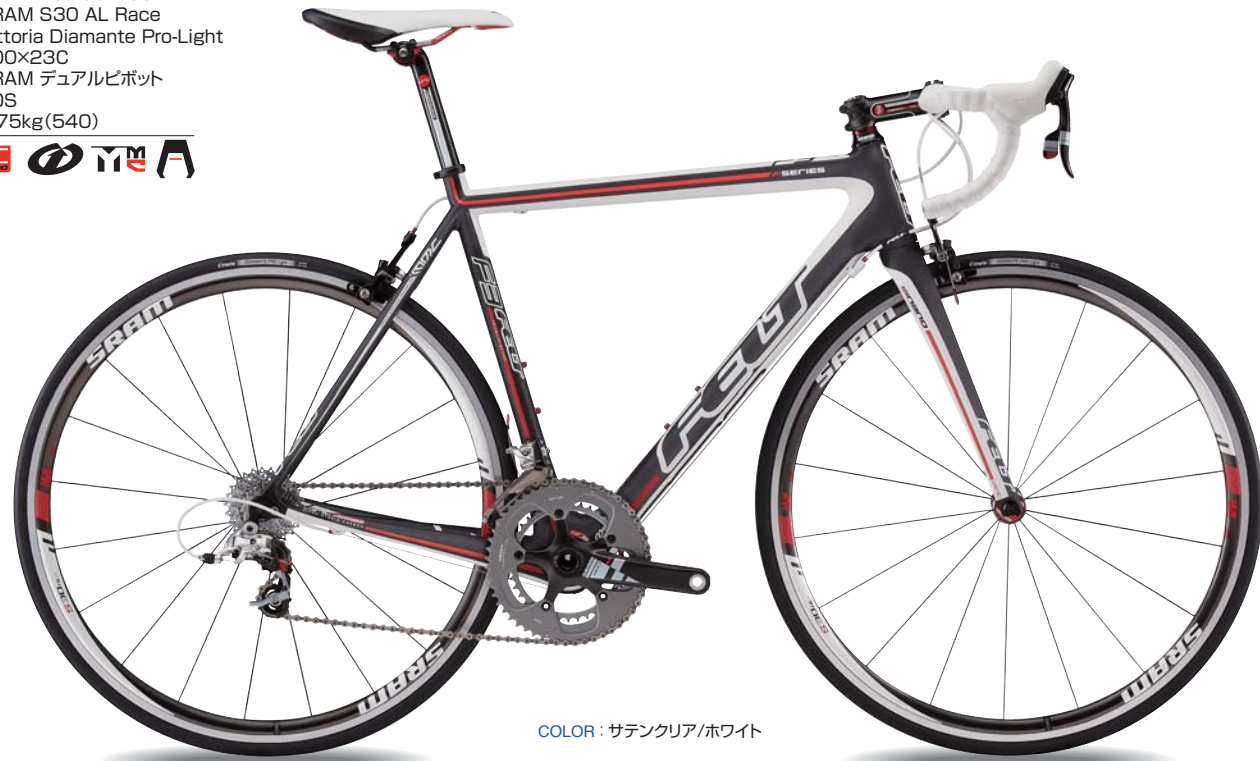
COLOR : サテンクリア/ホワイト