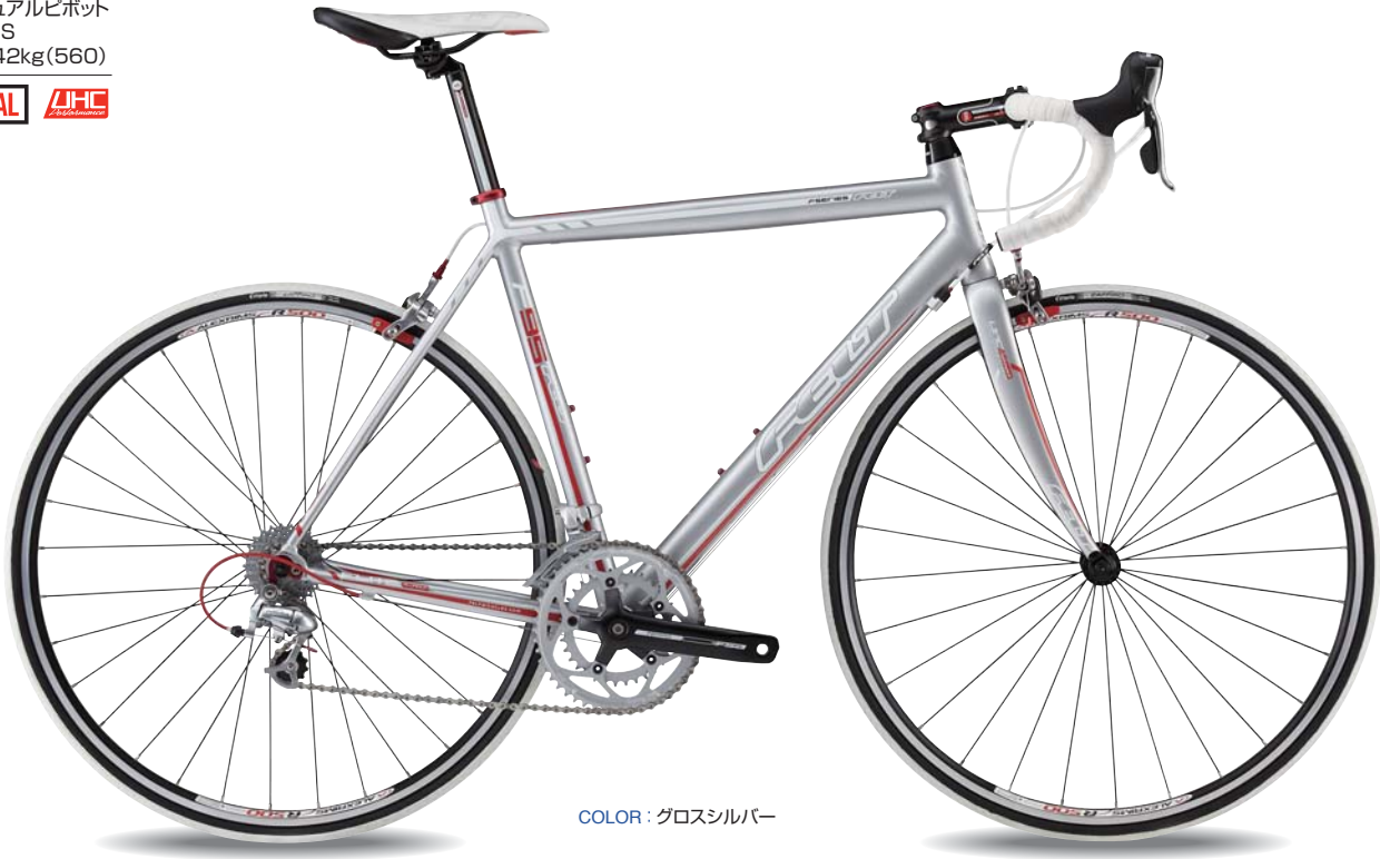
COLOR : グロスシルバー