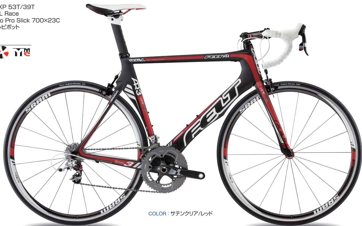
COLOR : サテンクリア/レッド