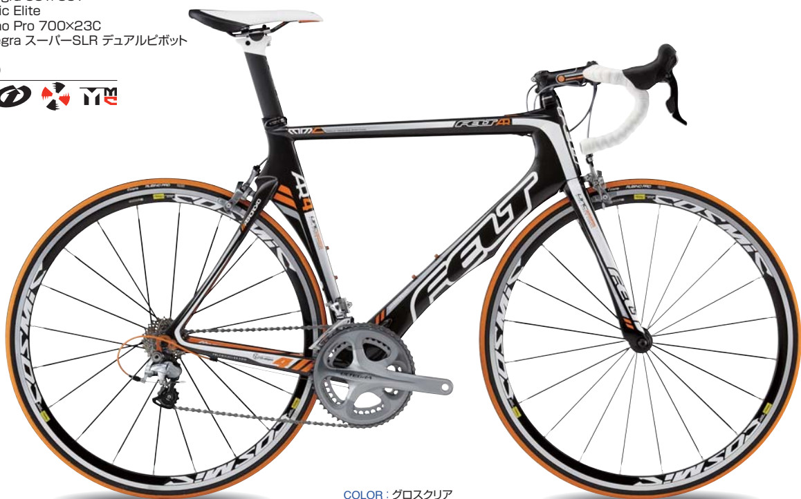
COLOR : グロスクリア