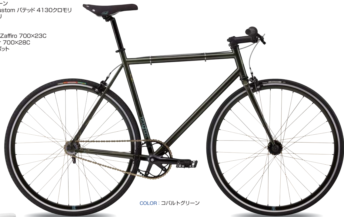
COLOR: コバルトグリーン

高品質な4130クロモリを使用したストリートピスト。 パイプの場所によって厚みを変えるバテッド加工を施す事で軽量化を実現。