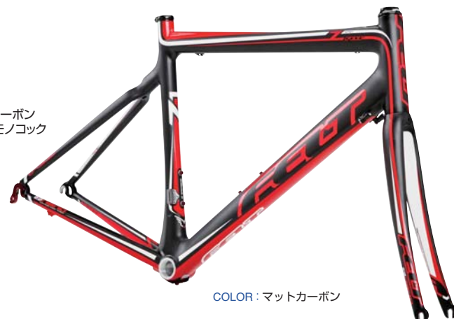
COLOR : マットカーボン