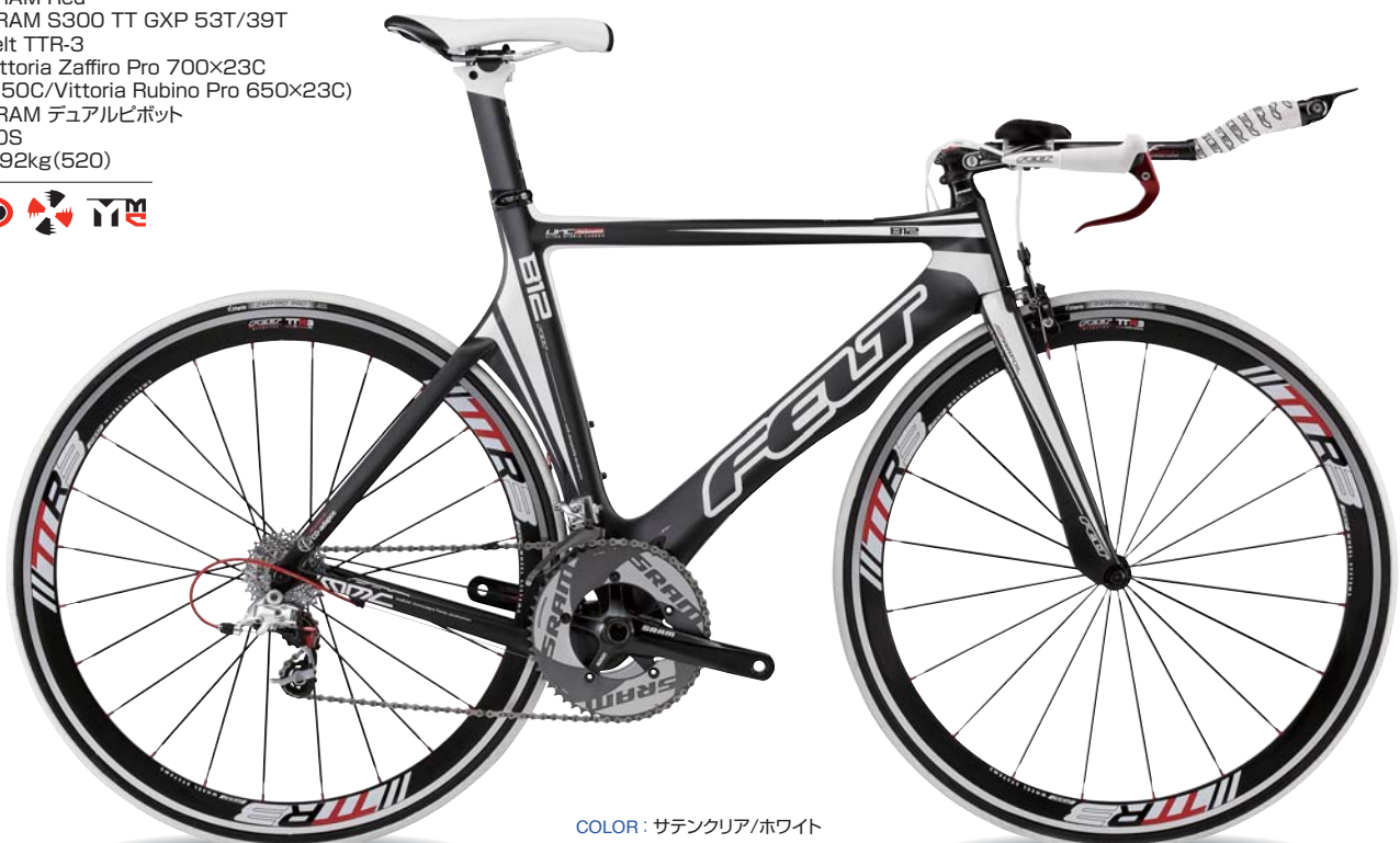
COLOR : サテンクリア/ホワイト