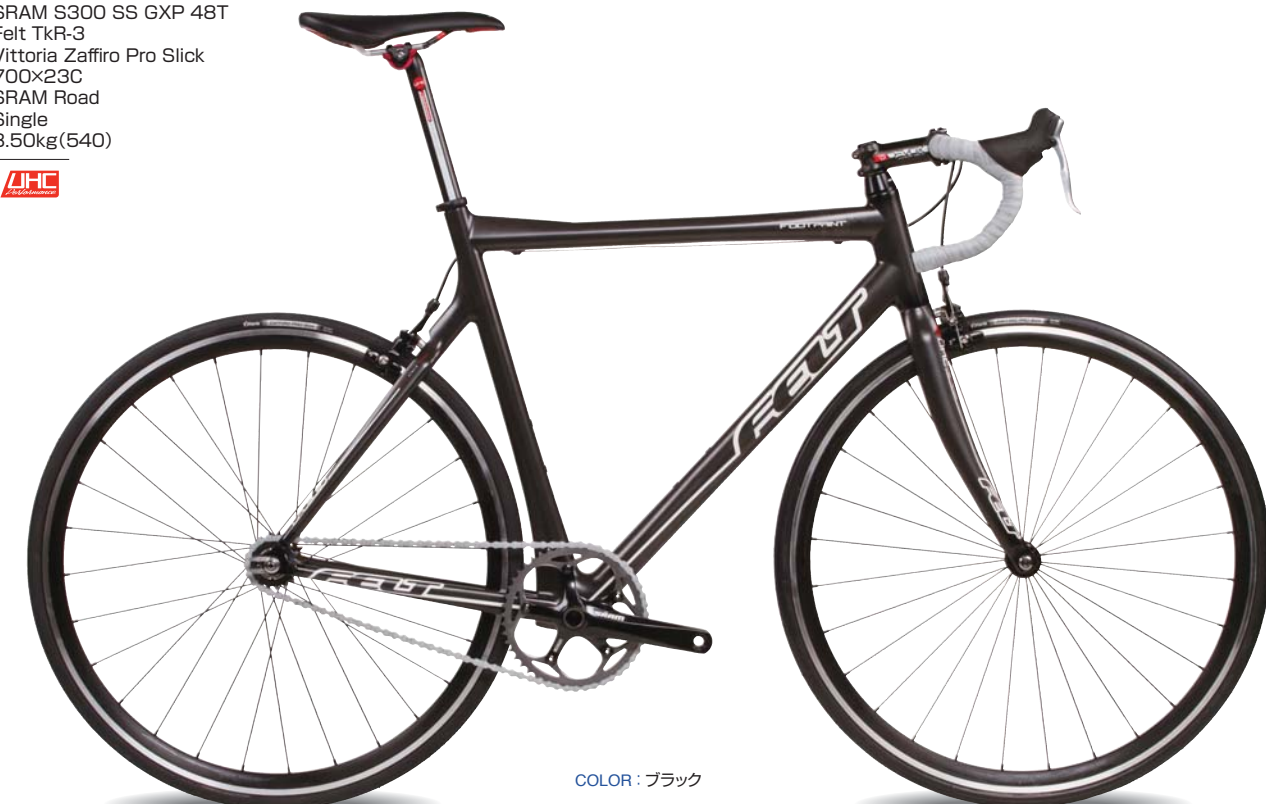
COLOR : ブラック