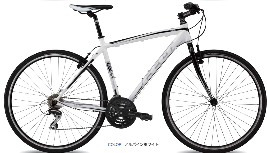
COLOR : アルパインホワイト

フレームは油圧形成されたハイドロフォーミングチューブで美しく。 スチール製リジッドフォークで走りも軽快です。