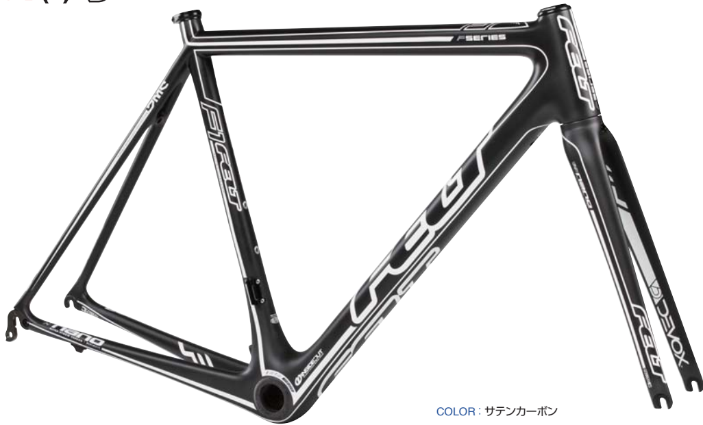
COLOR : サテンカーボン