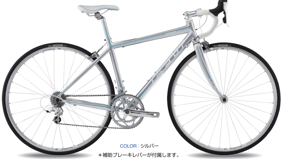
COLOR : シルバー *補助ブレーキレバーが付属します。