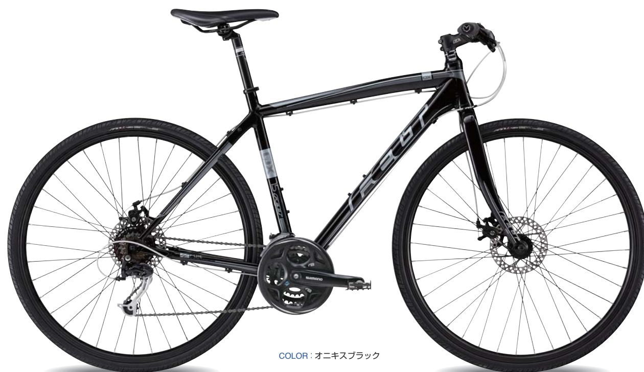
COLOR: オニキスブラック

軽量なアルミ製のフォークを採用する事で、 段差の少ない平坦路の走行性を高めたモデル。 ディスクブレーキの装着で雨天時でも、 より安定した制動力を発揮します。