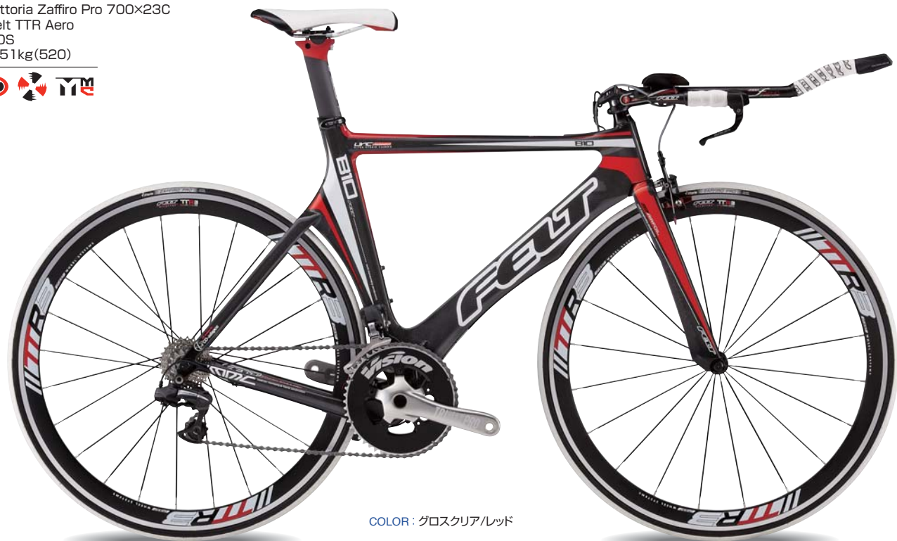
COLOR : グロスクリア/レッド