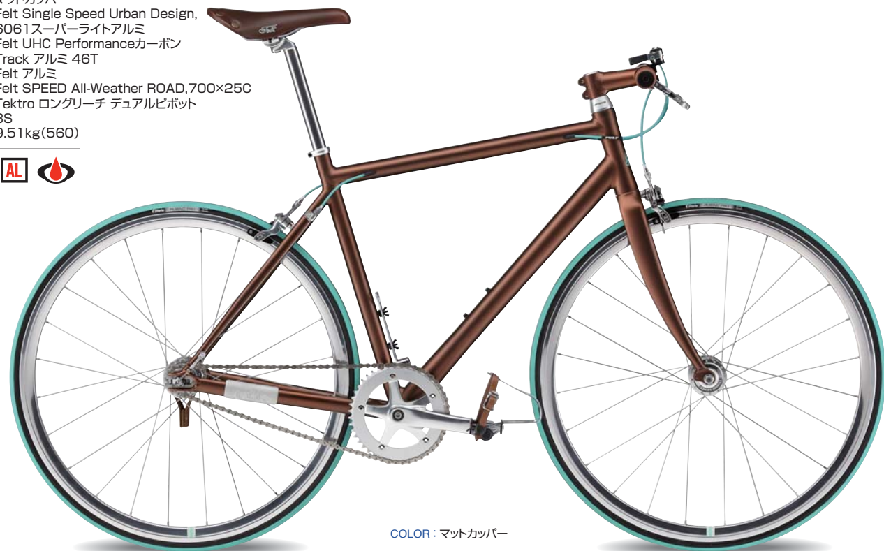
COLOR : マットカッパー