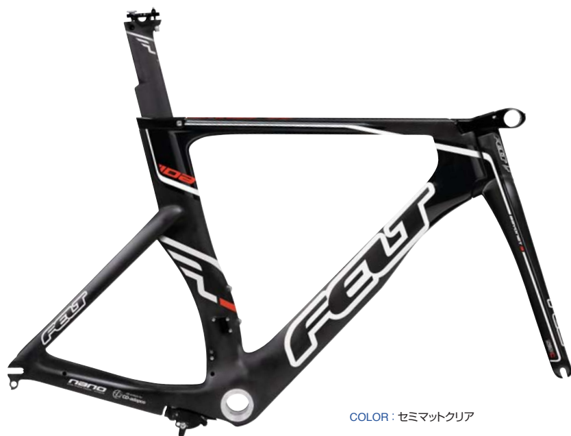
COLOR : セミマツクリア