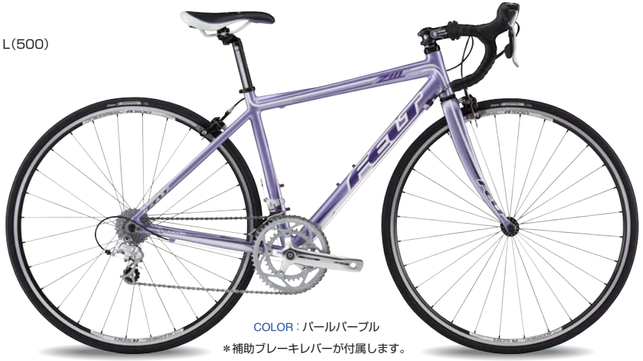
COLOR : パールパープル *補助ブレーキレバーが付属します。