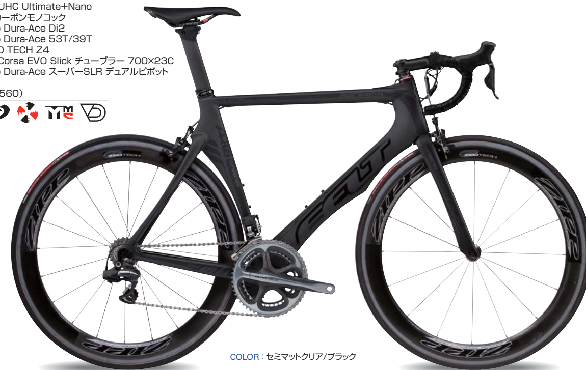
COLOR : セミマットクリア/ブラック