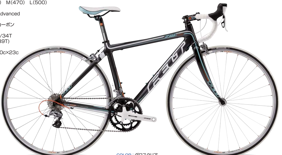
COLOR : グロスクリア