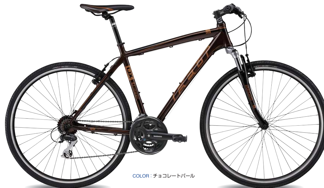
COLOR: チョコレートパール