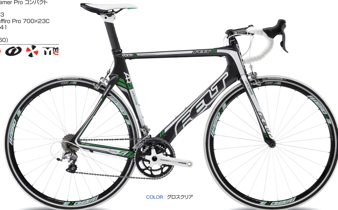
COLOR : グロスクリア