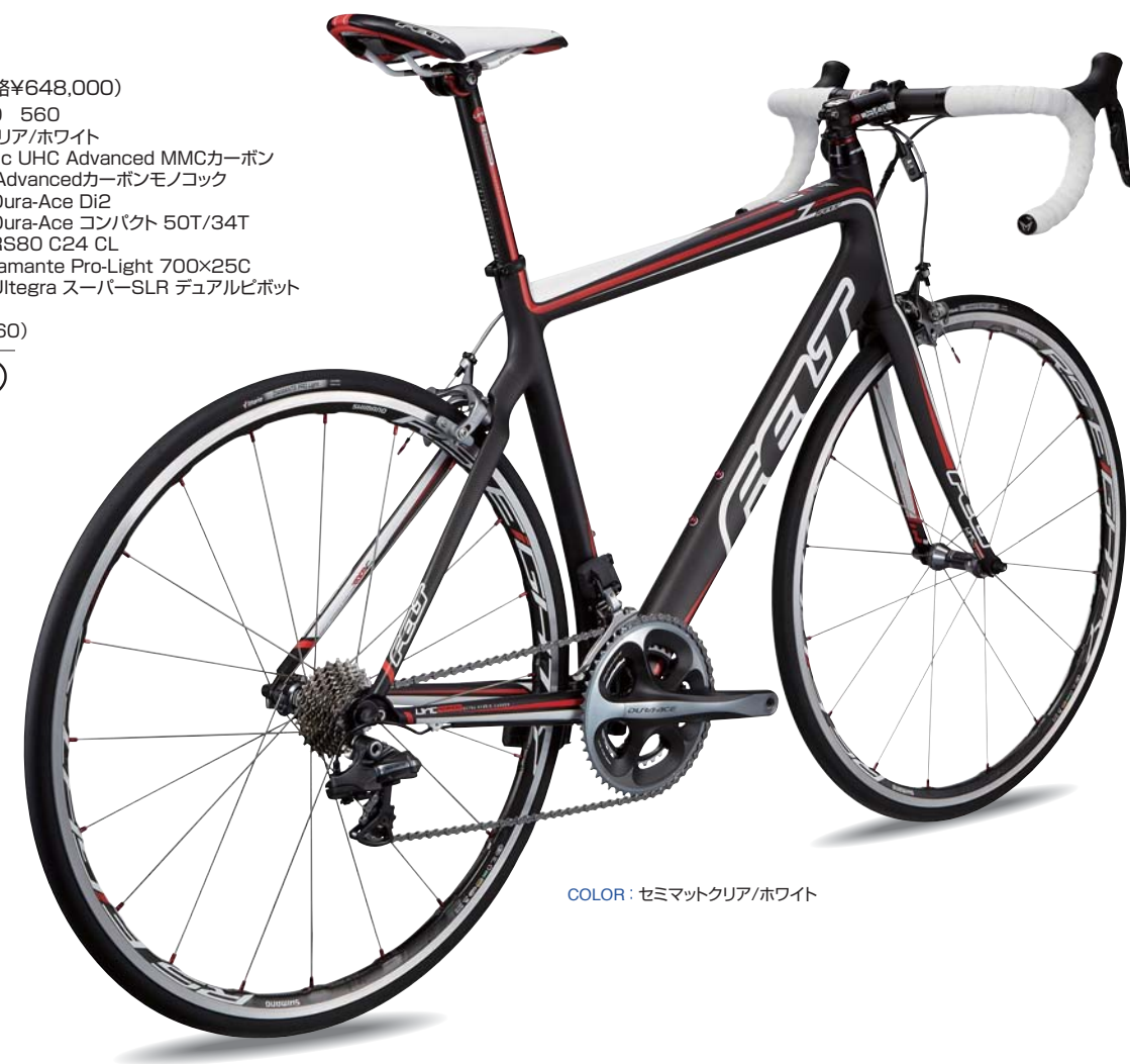
COLOR: セミマットクリア/ホワイト