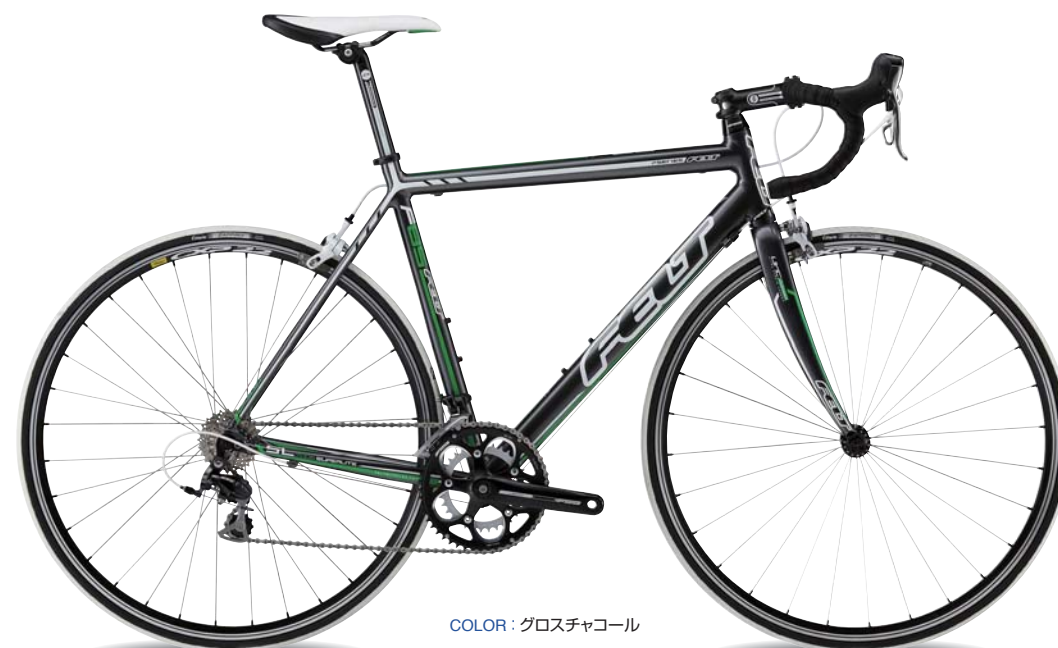
COLOR: グロスチャコール