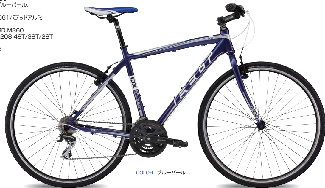
COLOR : ブルーパール