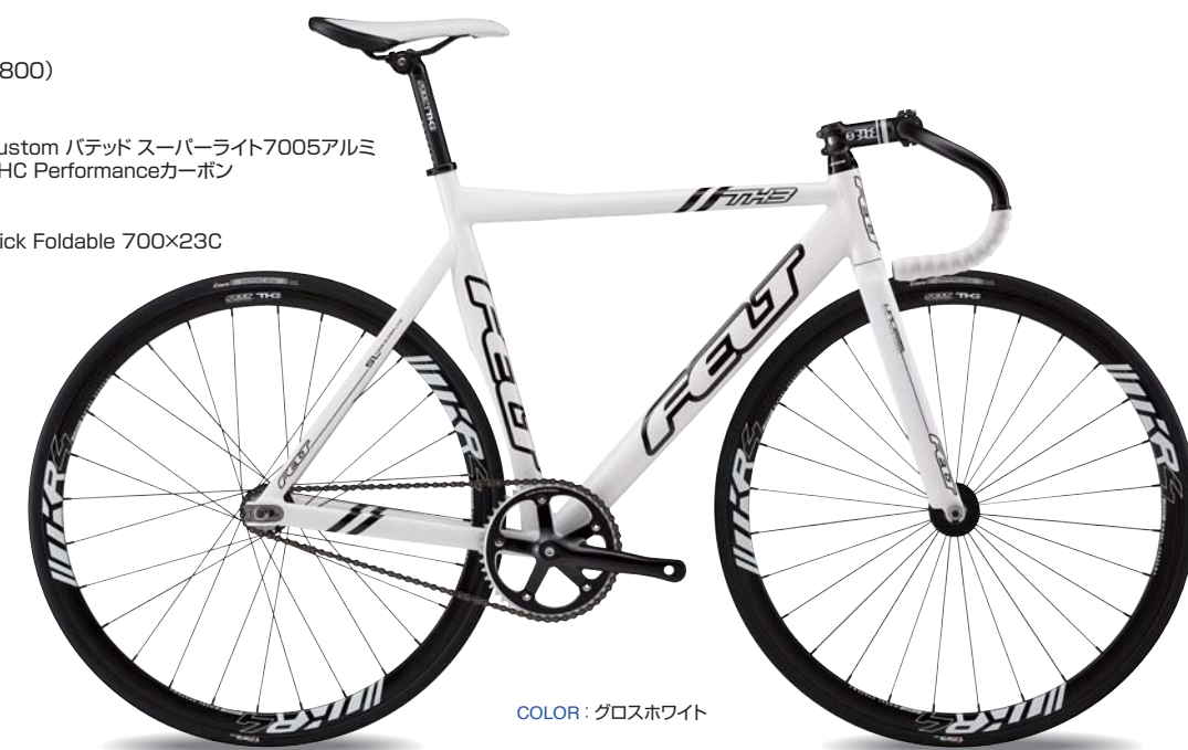
COLOR : グロスホワイト