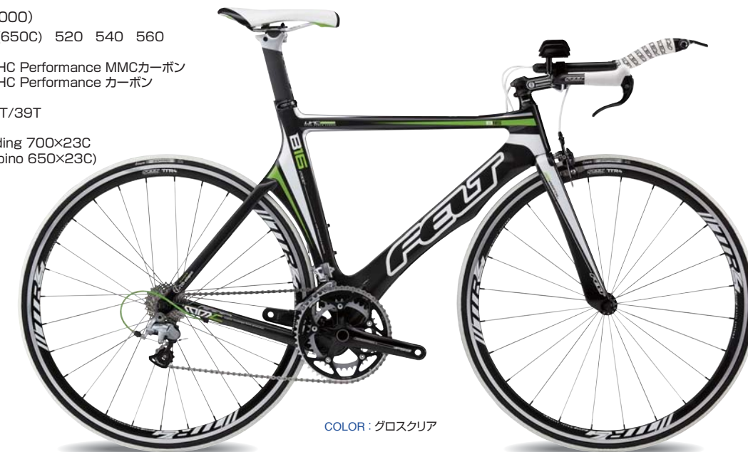
COLOR : グロスクリア