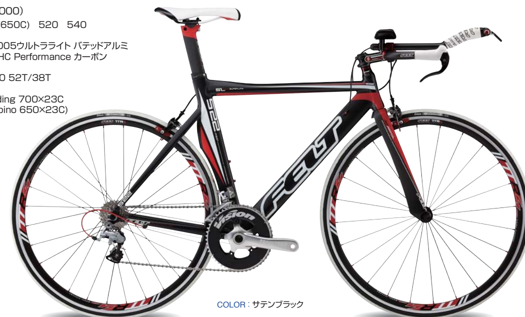
COLOR : サテンブラック