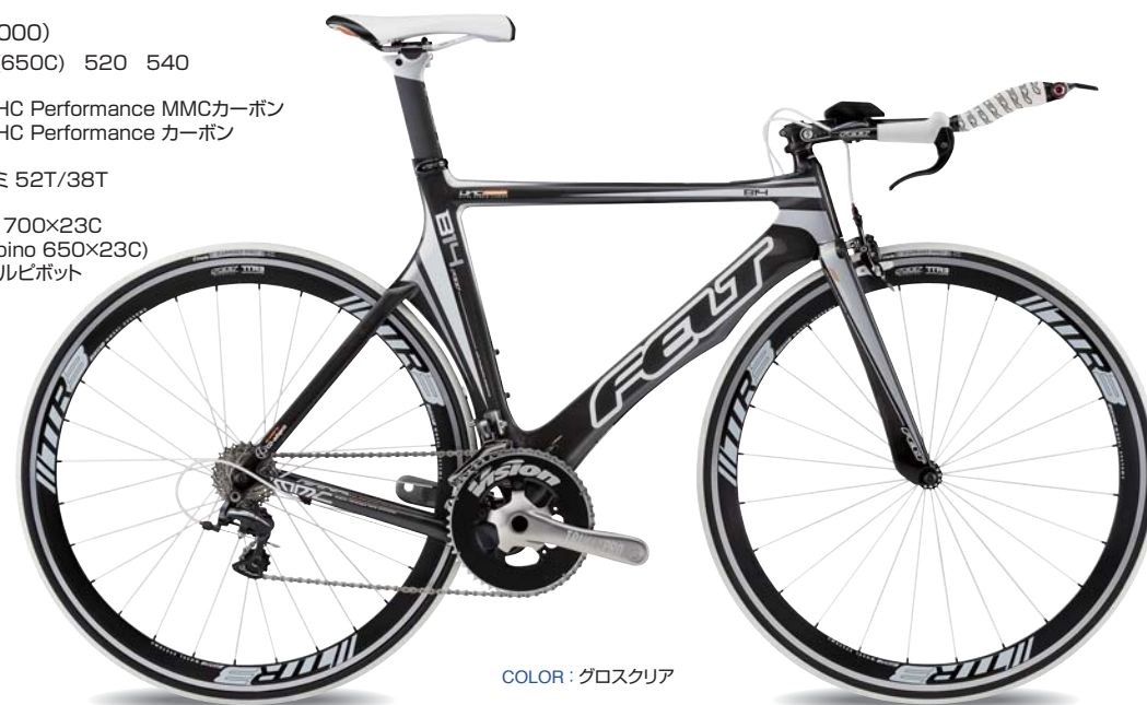
COLOR : グロスクリア