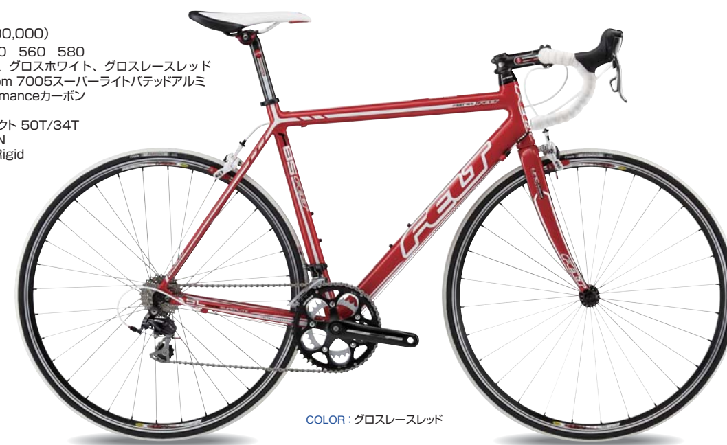
COLOR: グロスレースレッド