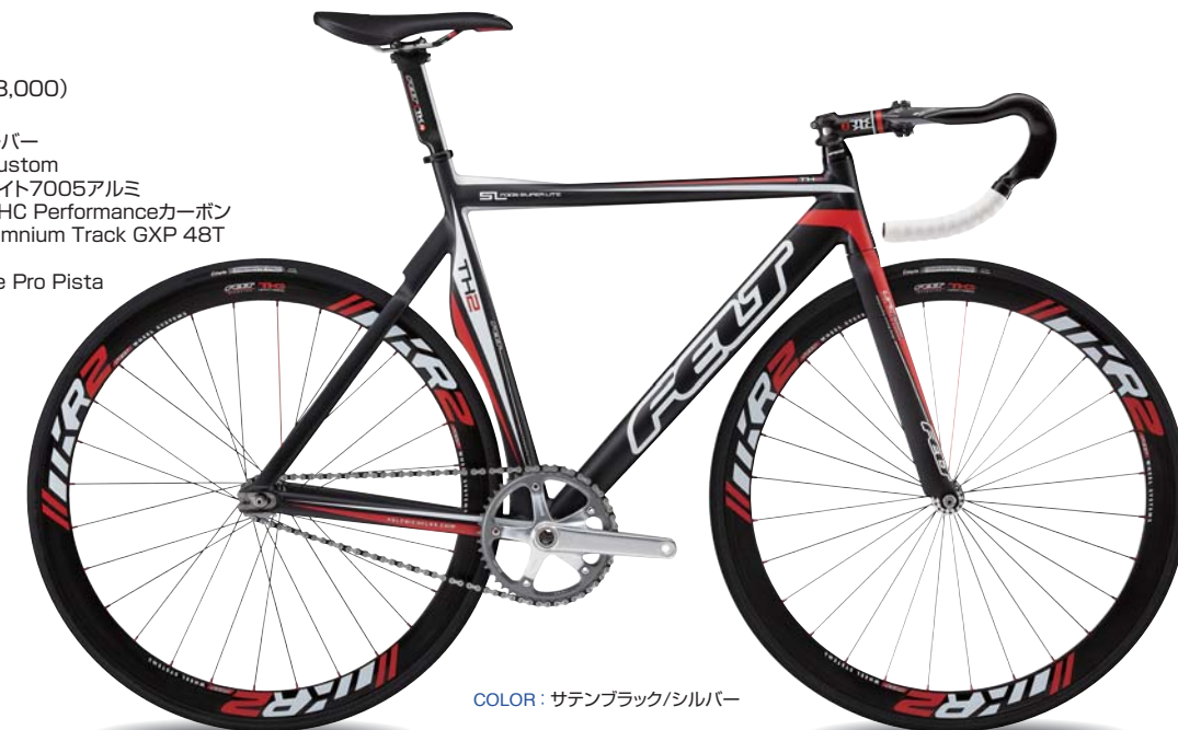
COLOR : サテンブラック/シルバー