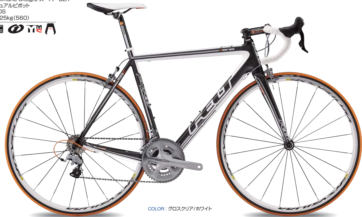
COLOR : グロスクリア/ホワイト