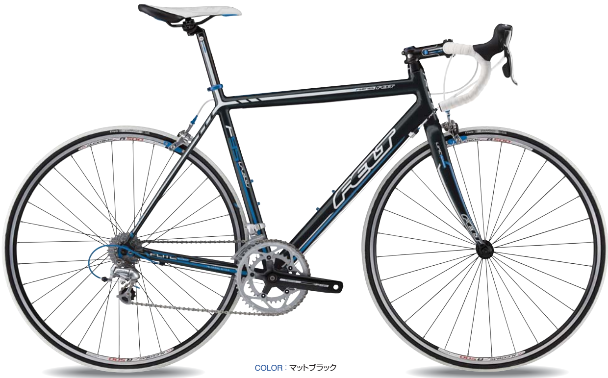
COLOR : マットブラック

¥281,400(税抜価格¥268,000) SIZE 510 540 560 580 COLOR サテンカーボン FRAME Felt Road UHC Ultimate + Nano DMCカーボン FORK Felt UHC Ultimate + Nano 100%カーボンモノコック HEADSET FSA インテグレートッド SEATPILLAR N/A SEATCLAMP 7075スーパーライト アルミ WEIGHT 800g(560)