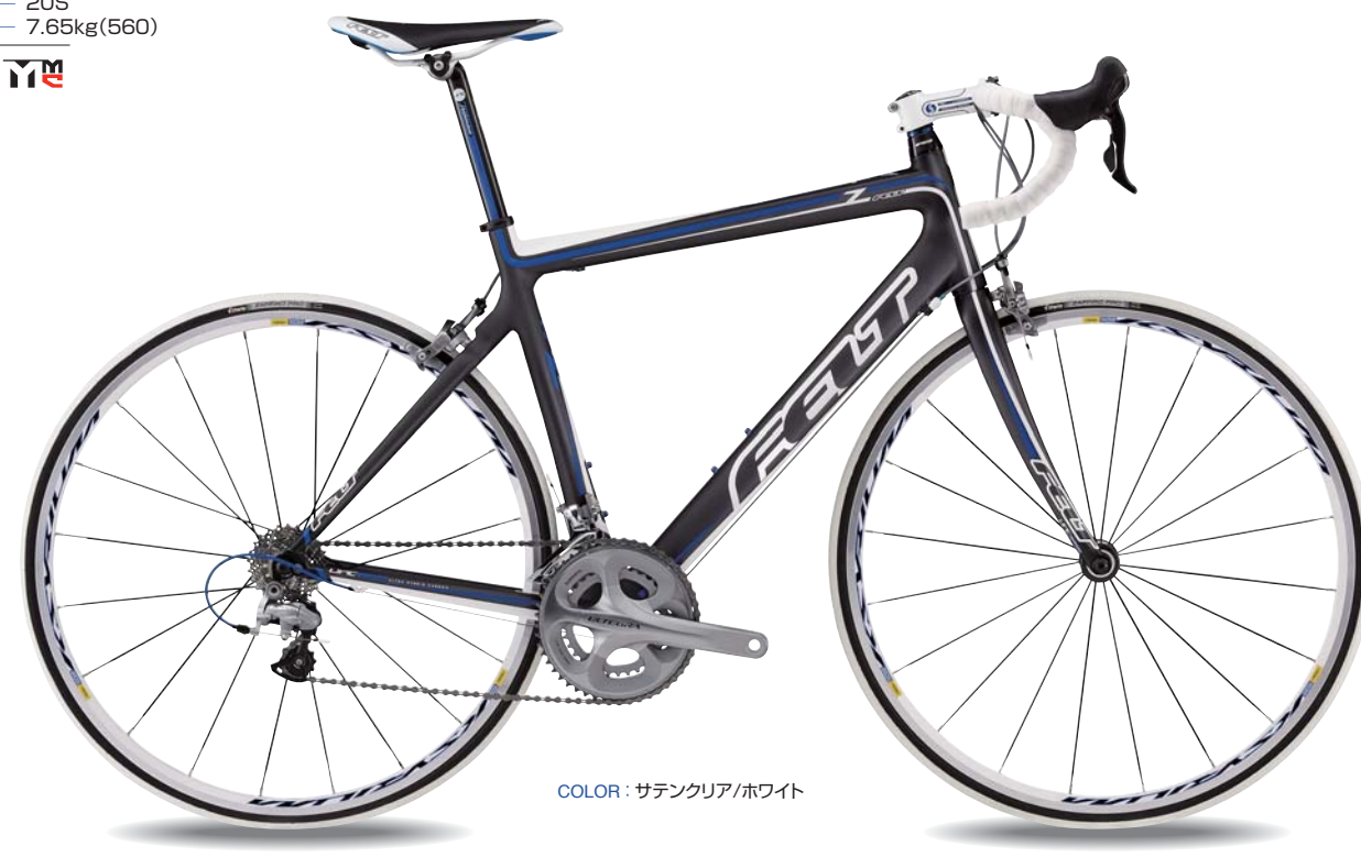
COLOR: サテンクリア/ホワイト