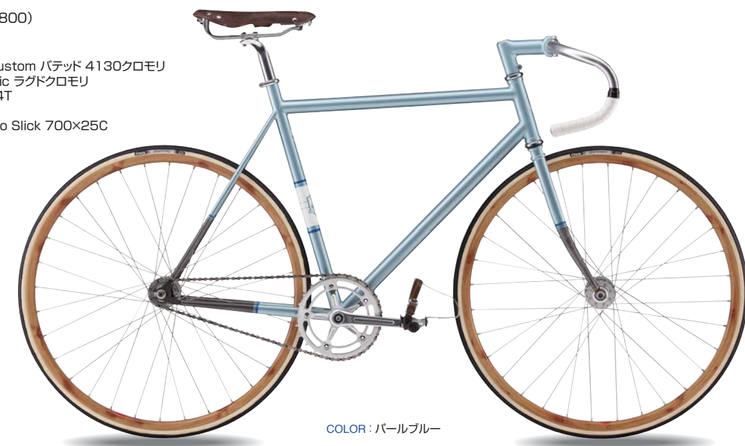
COLOR : パールブルー

*TKシリーズはトラック専用です。(一般公道走行不可) ブレーキは付属していません。