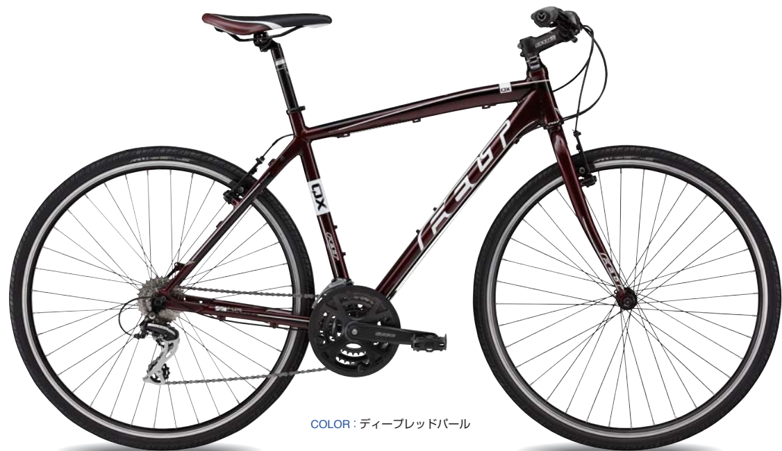
COLOR : ディーブレッドパール