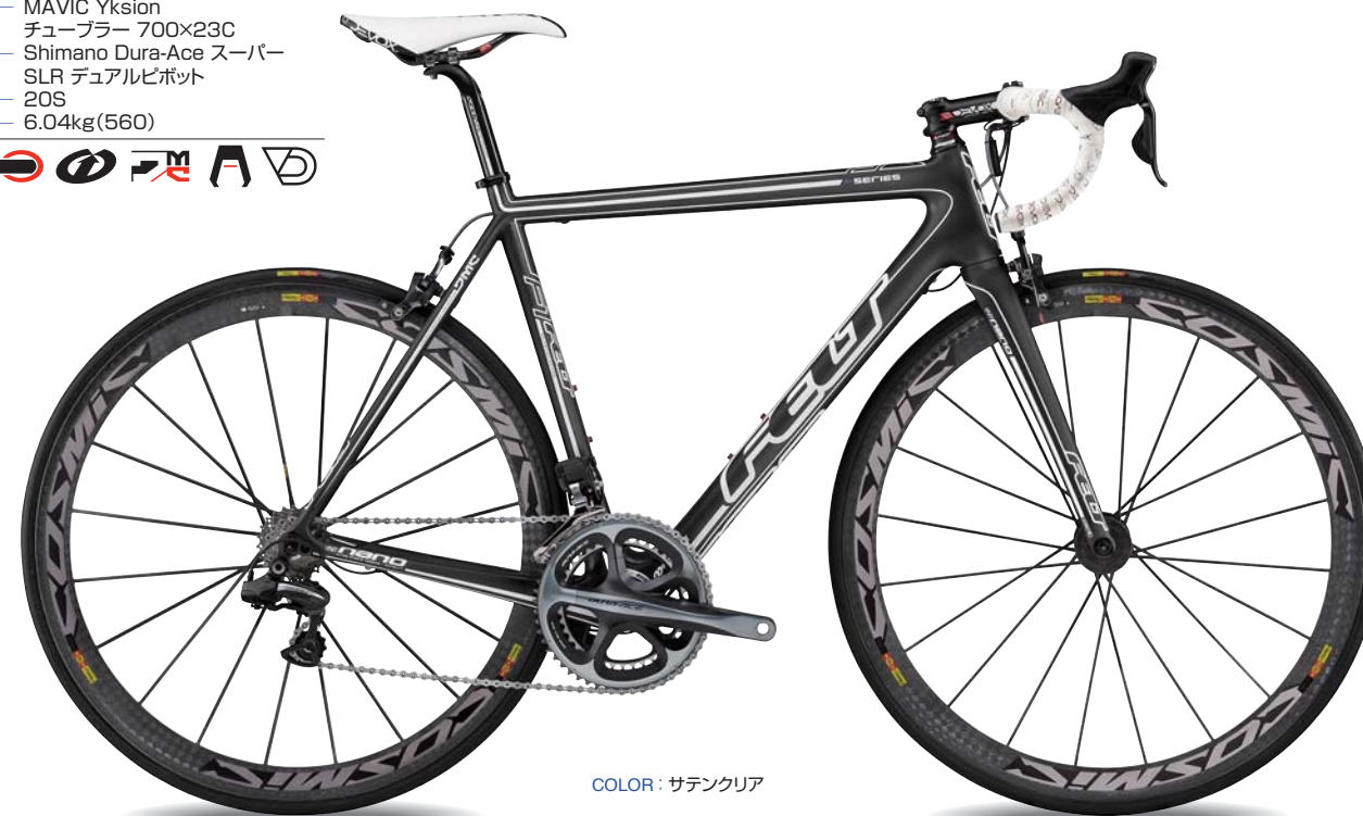
COLOR : サテンクリア