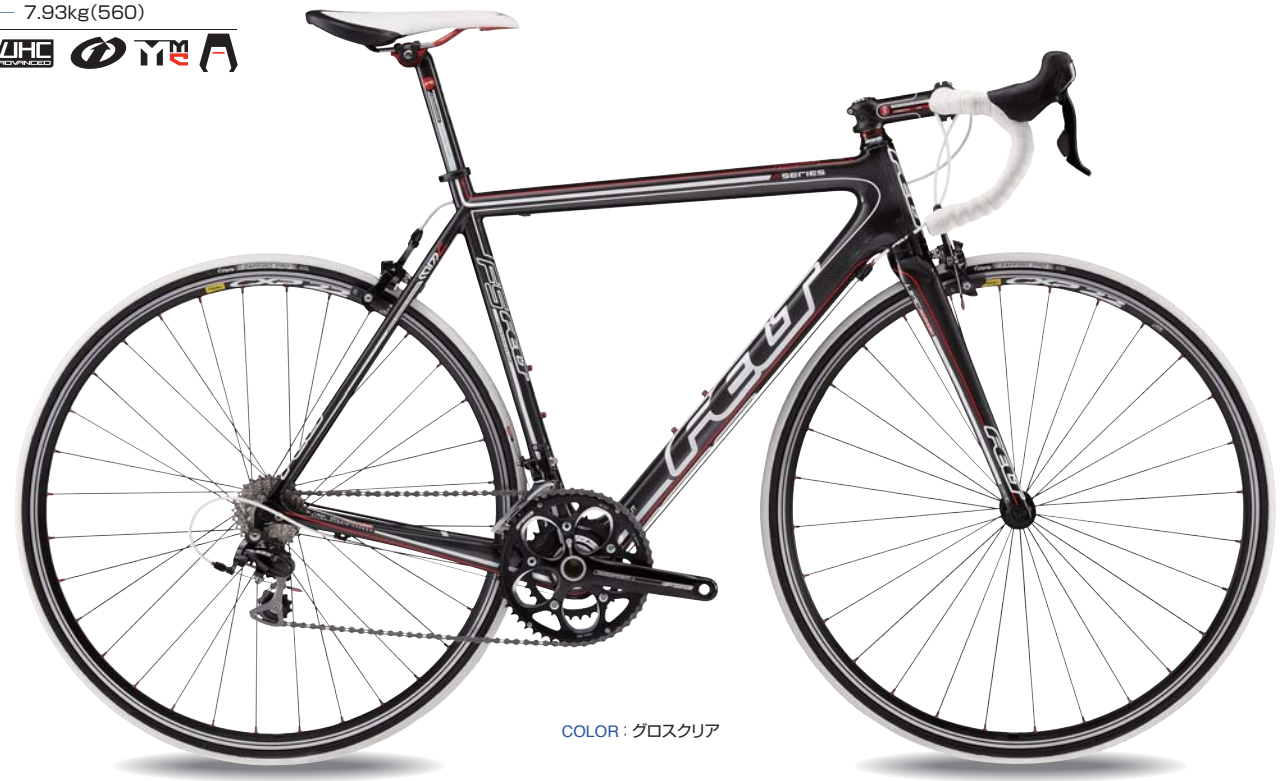
COLOR : グロスクリア