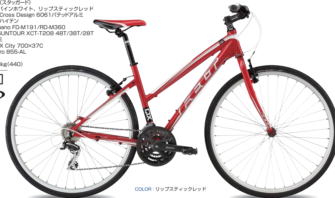
COLOR : リップスティックレッド