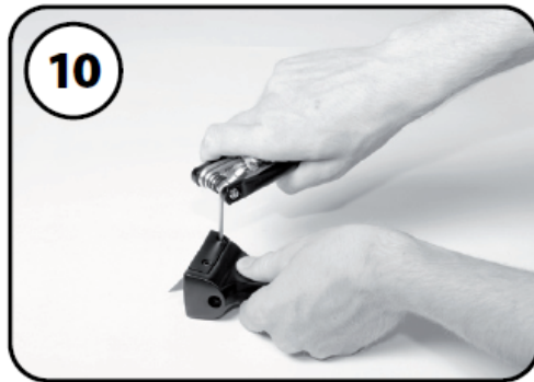
⑩カッターブレードをしっかりと固定する