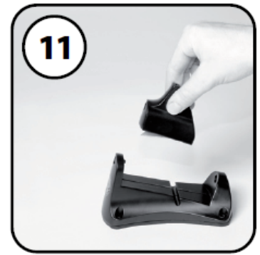
⑪ホルダーを本体に取付ける