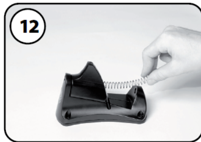
⑫リターン Springs を取付ける