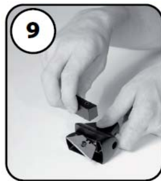
⑨カッターホルダーの組立