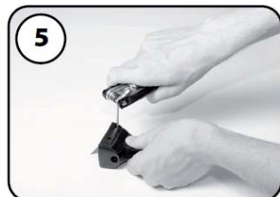
⑤カッターホルダーを分解