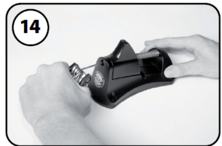
⑭スライド軸をしっかりと固定する

(注意) この油圧ブレーキ用ホースカッターは、ブレーキやシフトワイヤー用のケーブルアウターには使用できません。また金属製の油圧ブレーキホースにも使用できませんのでご注意ください。