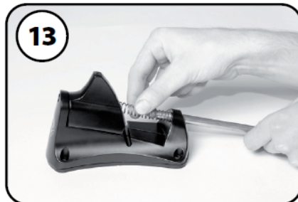
⑬リターン Springs とスライド軸を組立