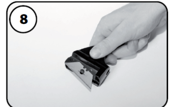
⑧ブレードの取り付け