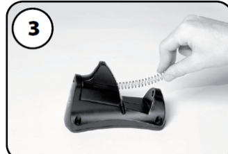
③リターン Springs を外す