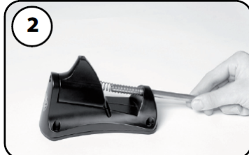
②カッターのスライド軸を外す