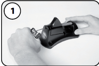
①ブレードホルダーの取り外し